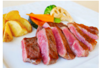
Beef sirloin steak USサーロインステーキ セット ¥5,700 単品 ¥4,000

*1ハーフブッフェ…地産野菜のサラダバーやオードブル、スープ、パン、ライス、季節のデザート等 ※ドリンクバーは別途料金¥600となります/※写真はイメージです。食材の入荷状況により一部変更する場合がございます。