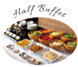
Half Buffet ハーフブッフェ*1とセットで お楽しみいただけます