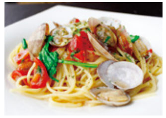
Pasta スパゲティボンゴレピアンコ セット ¥3,500 単品 ¥1,800