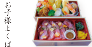
¥3,500 ホテル特製牛ハラミ重に お魚やお肉、サラダ等 おかずを詰めた洋風ボックス サイズ 一段 縦11×横20.6×高4.8cm