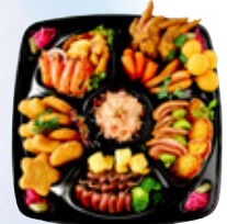
¥10,000 お集まりの宴会や法事等 10,000円〜より承ります サイズ 縦40×横40×高4cm