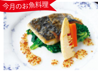
今月のお魚料理 Fish dish 鱈のポワレ セット ¥3,800 単品 ¥2,100