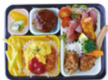
¥2,500 オムライスにエビフライ、ハン バーグなどお子様の大好きを 詰め合わせたよくばり弁当 サイズ 縦17.5×横23.5×高4cm

※お受け取りのお時間はご相談ください。 ※温度・衛生管理に最新の注意を払い保存料を使用せず お受取りの時間に合わせてお作りしております。 そのための消費期限はお弁当を仕上げてから6時間後となります。 ※全ての商品に割箸、紙おしぼりをお付けいたします。予めご了承ください。 ※季節により内容が変更する場合がございます。予めご了承ください。 ※表記料金には消費税8%が含まれております。※写真はイメージです。