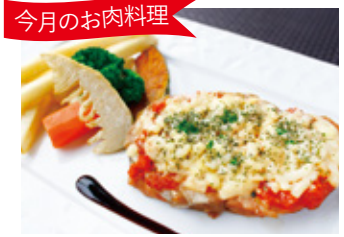
今月のお肉料理 Meat dishes 豚肩ロース肉のトマトチーズ焼き セット ¥3,800 単品 ¥2,100