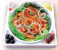
¥3,500 桜チップで燻製させた こだわりのスモークサーモン サイズ 縦21.7×横21.7×高4cm