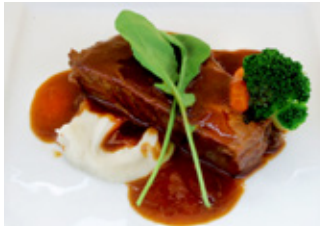
Beef Stew 至福のビーフシチュー セット ¥4,200 単品 ¥2,500