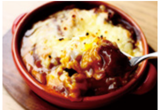
Curry とろっと牛すじ焼きカレー セット ¥3,500 単品 ¥1,800