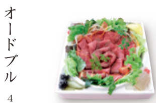
¥6,500 黒毛和牛を使用した ホテル特製のローストビーフ サイズ 縦21.7×横21.7×高4cm