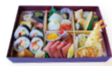
¥6,800 季節の食材を使用した焼き合 わせやお造り、天婦羅に巻き 寿司など充実した和のお弁当 サイズ 縦21.4×横32×高5.8cm