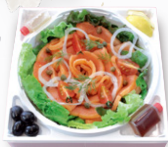
自家製 スモークサーモン (250g 約4人前) ¥3,200