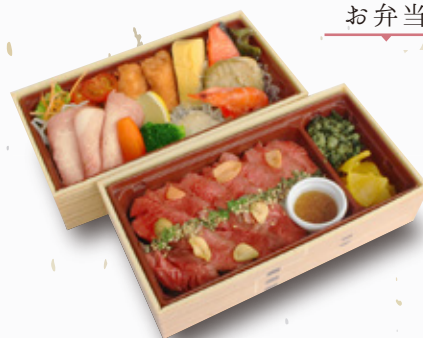
シャリアピンステーキ重と デリフードボックス ¥2,800