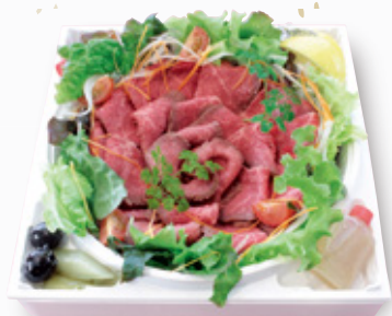
黒毛和牛 ローストビーフ (250g 約4人前) ¥6,200