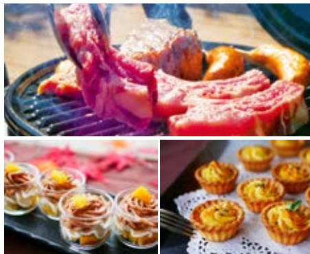
※写真はスペシャルブッフェのイメージです。