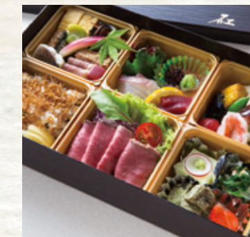
※写真は和~なごみ~です