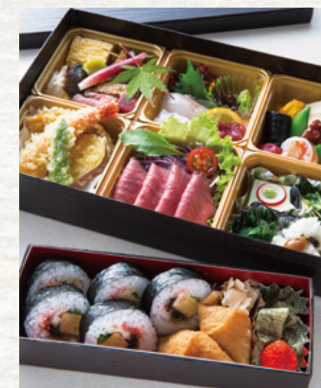
※写真は雅~みやび~です